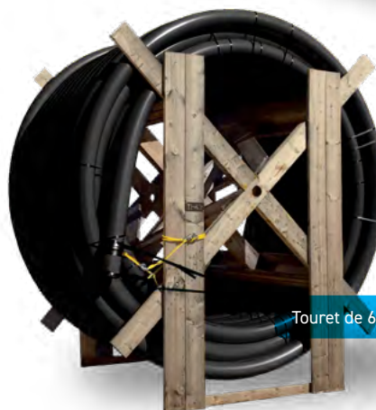
Touret de 6"