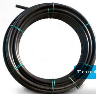
3" en rouleau