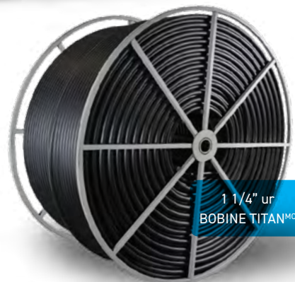
1 1/4" sur BOBINE TITAN MC