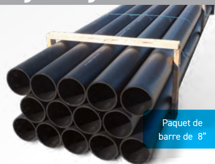
Paquet de barre de 8"

*Toutes autres longueurs spéciales disponibles sur demande.