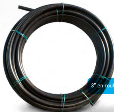
3" en rouleau