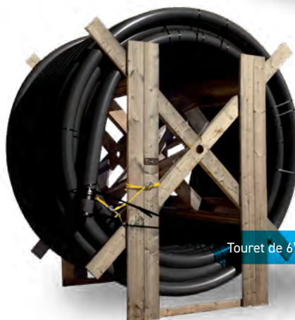
Touret de 6"