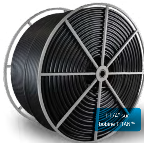
1-1/4" sur bobine TITAN MC

Références: Normes BNQ 3660-950 et 3624-027 — Normes ASTM D3350, F2620 ET F714 — Normes CSA B137.1 — ANSI/AWWA C901 et C906 — NSF 14 — Plastics Pipe Institute (PPI), http://plasticpipe.org/publications/pe_handbook.html