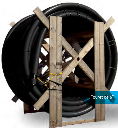
Touret de 6"