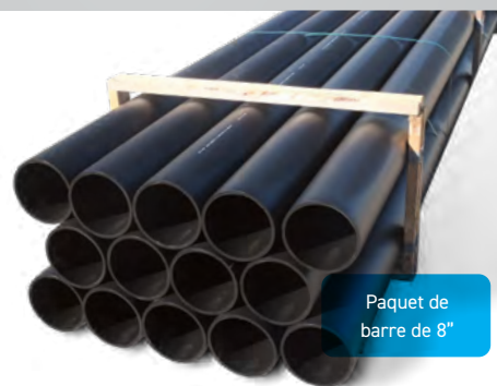
Paquet de barre de 8"