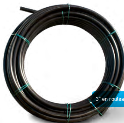
3" en rouleau